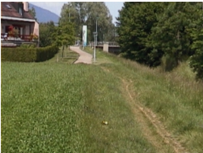
Cheminement naturel en direction du Cheminet