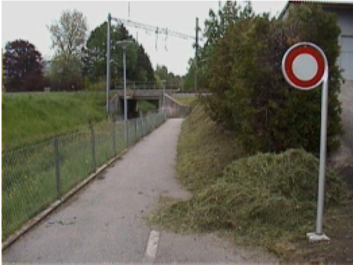
Vue depuis Bouby Rolls